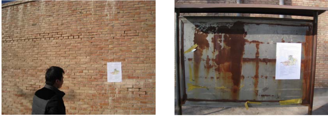
图 3-5 现场张贴公示