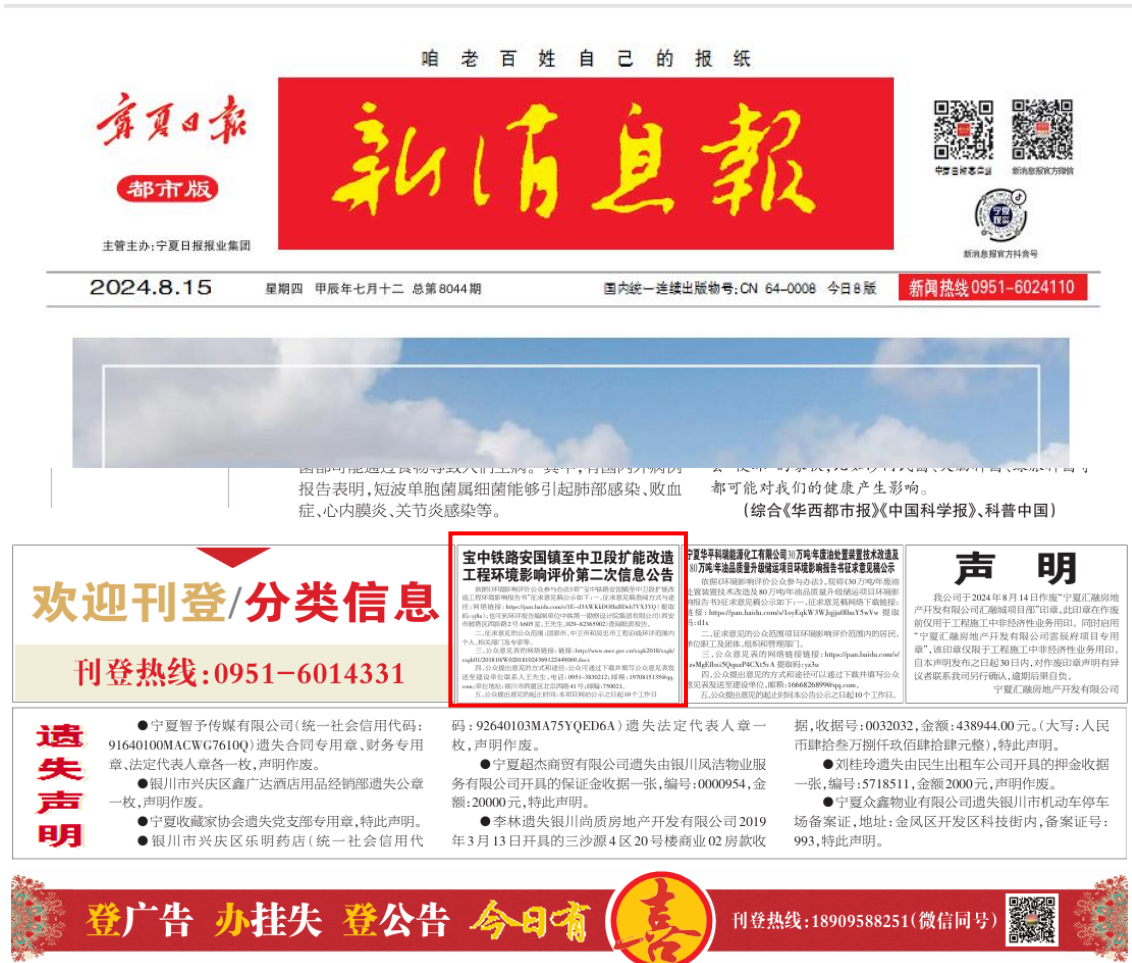
图 3.2-3 新消息报第二次信息公示截图（2024 年 8 月 15 日）