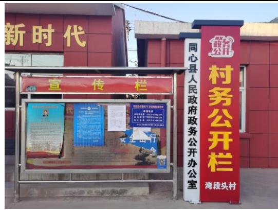
地点：园艺村新村、湾段村