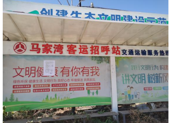
地点：石头河湾、马家湾