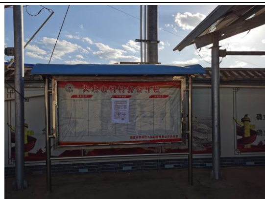
地点：大北山、蒋河村