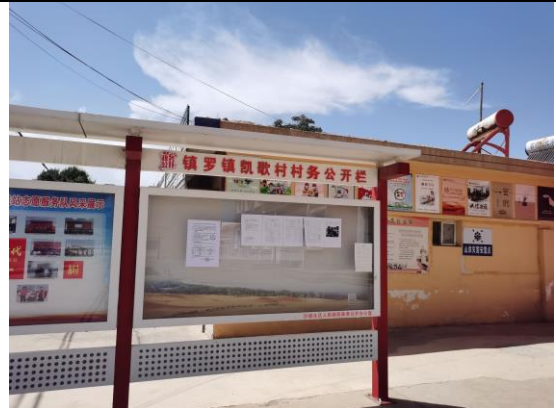
地点：凯歌村、刘庄村