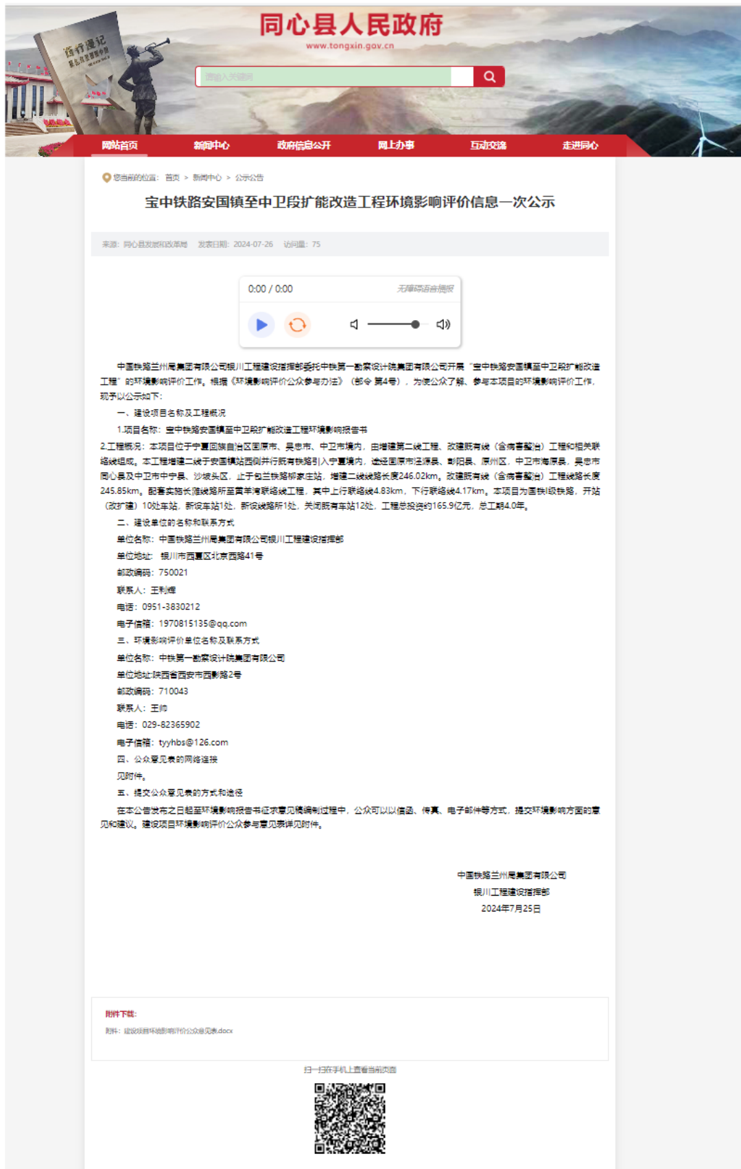
图 2.2-3 一次公示截图（同心县人民政府-2024 年 7 月 26 日）