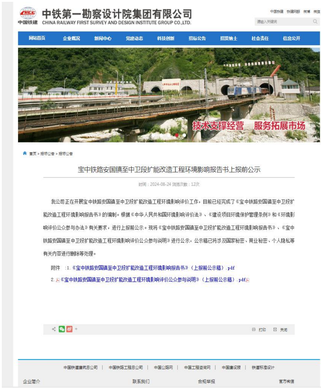
图 3.2-4 项目环评上报前信息公示截图（2024 年 8 月 24 日）

2024年8月24日，我单位在向宁夏回族自治区生态环境厅上报环境影响报告书前，将对环境影响报告书在中铁第一勘察设计院集团有限公司网站上进行全文及公众参与说明进行公示（网址： http://www.fsdi.com.cn/art/2024/8/24/art_3956_4958628.html ），公开的报告书全本删除了涉及国家秘密、商业秘密等依法不应公开内容。