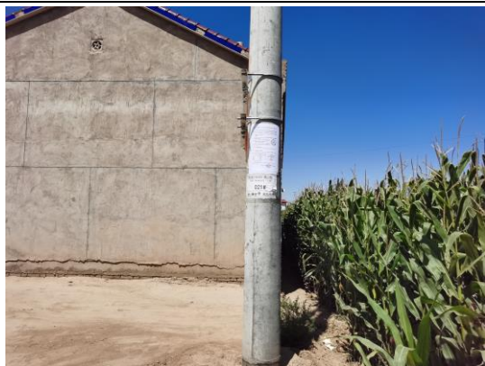
地点：北堡子、丁家滩