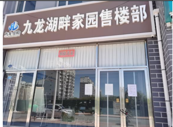
地点：九龙湖畔家园