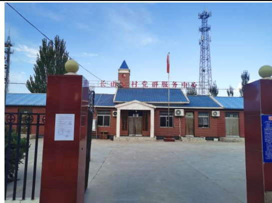
地点：长山头村、长山村