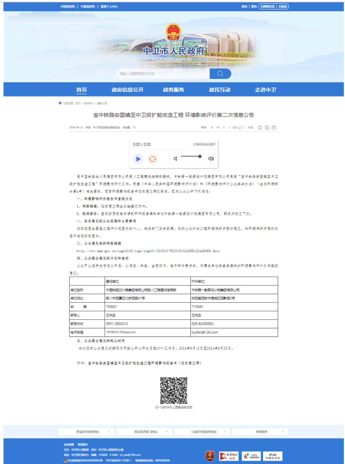
图 3.2-2 二次信息公示截图（中卫市人民政府）