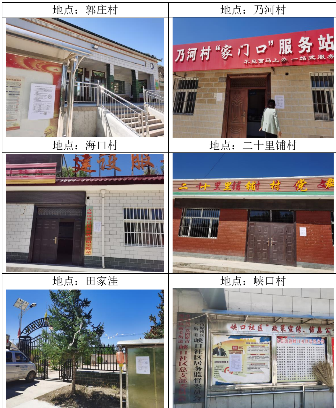
二次公示张贴情况表