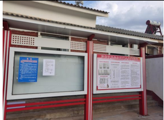
地点：花豹湾一队、花豹湾康滩村