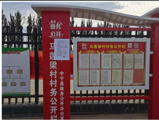
地点：西沙窝村、马莲梁村