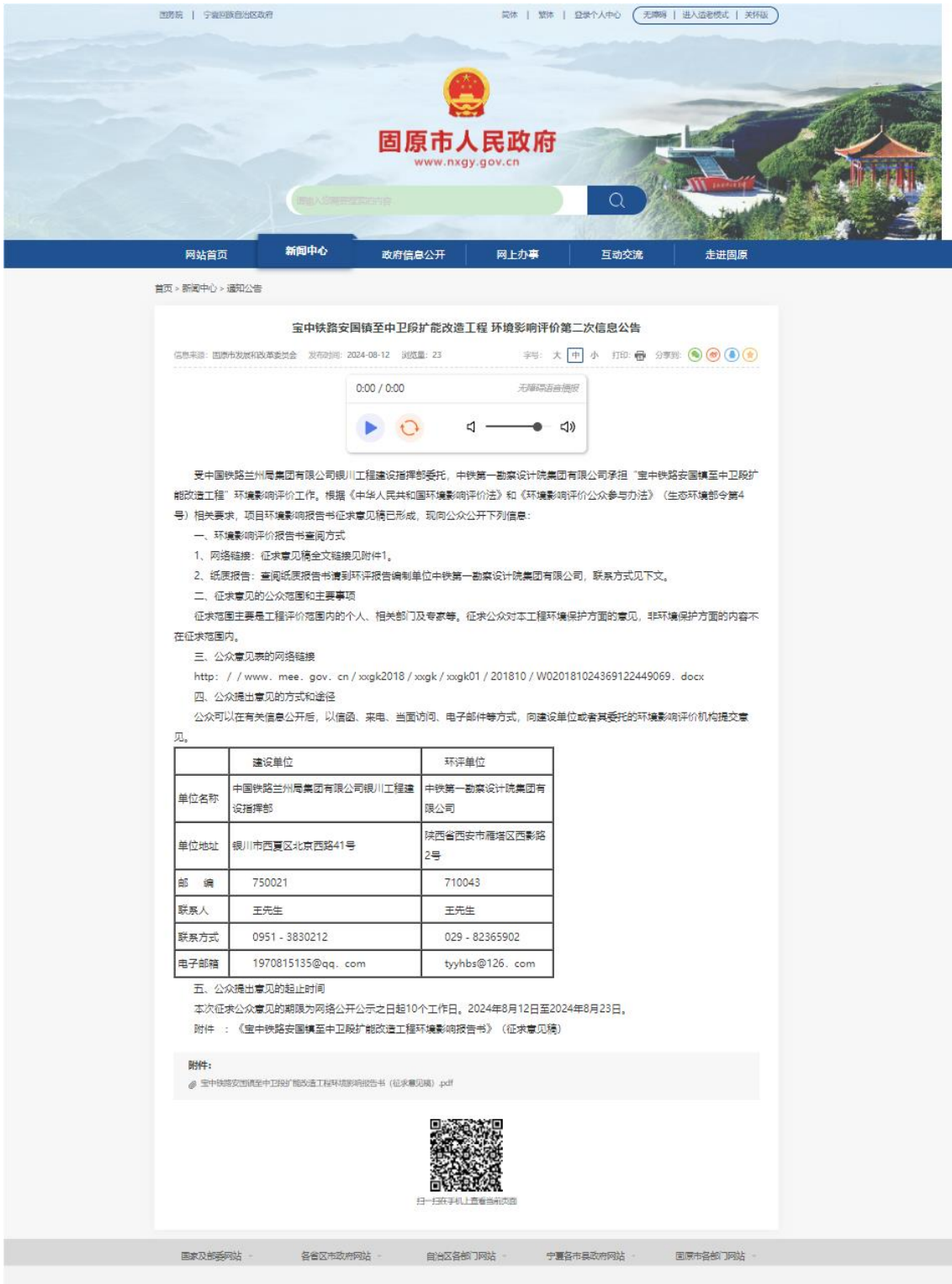
图 3.2-1 二次信息公示截图（固原市人民政府）