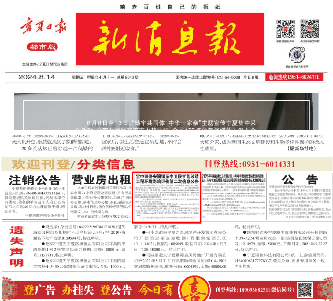
图 3.2-2 新消息报第二次信息公示截图（2024 年 8 月 14 日）

征求意见稿公示期间分别于2024年8月14日和2024年8月15日在《新消息报》刊登了《宝中铁路安国镇至中卫段扩能改造工程环境影响报告书》（征求意见稿）信息公示，公示情况如图所示。