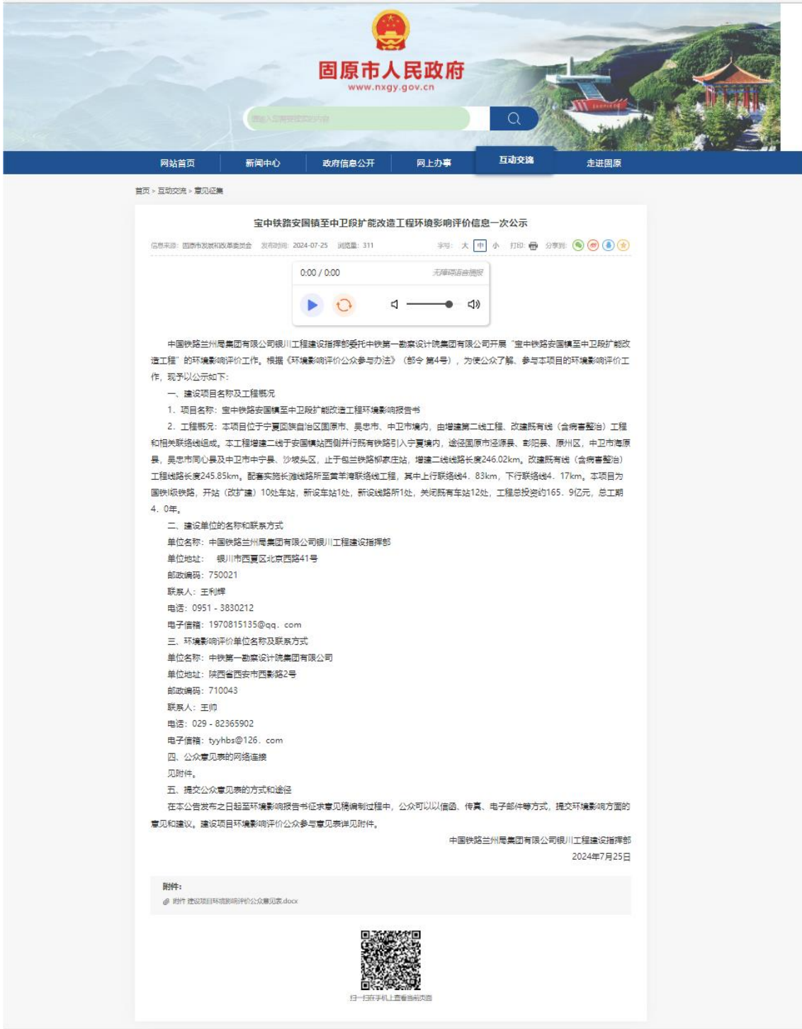
图 2.2-1 一次公示截图（固原市人民政府-2024 年 7 月 25 日）