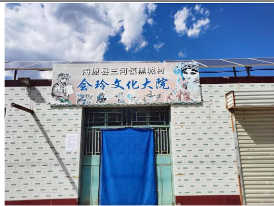
地点：黑城村、姚堡一队