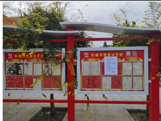
地点：东盛村六队、彭建村