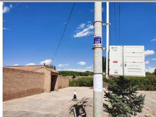
地点：坪路村六组、姚家湾