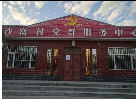
地点：沙窝村、梁家台