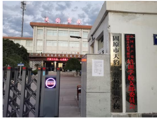
地点：天豹驾校家属院