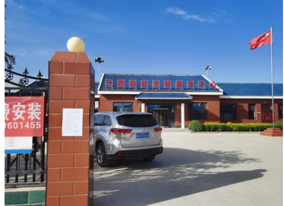
地点：大战场村、锅底坑村