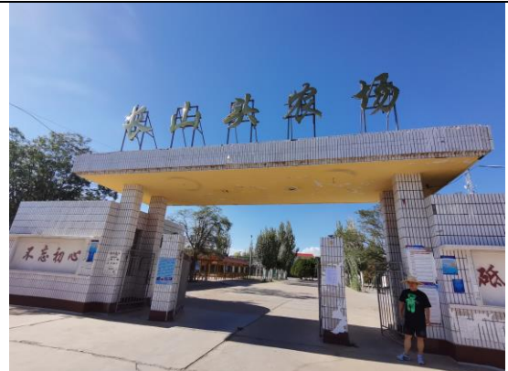
地点：长山沟农场、园林队