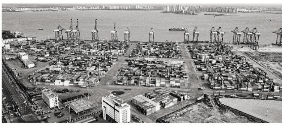
在海南洋浦经济开发区拍摄的洋浦港口岸,既是海南自贸港8个对外开放口岸之一,又是10个“二线口岸”之一(2025年11月21日摄)

“全岛封关是海南自贸港开放发展的新起点。”黄汉权认为,下一步,有关部门在制定封关政策制度措施基础上,可根据封关运作情况和开放发展实际,不断优化政策设计,坚持改革创新,推出一项、落实一项“一线”扩大开放领域,进一步吸引投资要素集聚,努力打造具有国际竞争力和影响力的海关监管特殊区域。